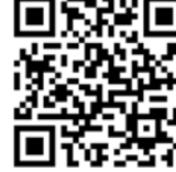
โปรแกรมสั่งซื้อและจัดส่งผลิตภัณฑ์อัตโนมัติ ต่ออายุอัตโนมัติ ทุก 6 เดือน