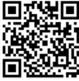
แผนรายได้ โไลฟ์แม็กซ์ พลัส